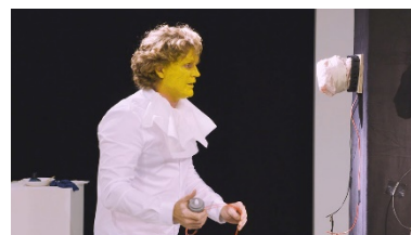
William Hunt – You're Gonna pay For it Now III , 2016

Dit jaar vindt de tiende editie plaats van de internationale beeldtentoonstelling Lustwarande in park De Oude Warande in Tilburg. Lustwarande begint het jubileumseizoen met het performance-programma Brief Encounters . Het gaat om twee series van drie performances van internationaal gerenommeerde kunstenaars. Ze vinden plaats op 26 mei 2019 en op 8 september 2019. Delirious is de tiende expositie in De Oude Warande, met voor het merendeel nieuwe werken van zesentwintig internationale kunstenaars. De jubileumtentoonstelling begint op 15 juni en loopt tot en met 20 oktober 2019.