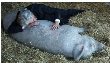
Melanie Bonajo - Night Soil - Nocturnal Gardening , 2016 HD video, Courtesy AKINCI