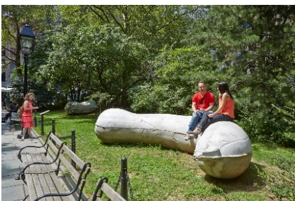
01. Sarah Lucas – Florian, installation view, Lightness of Being, 2013, The Public Art Fund at City Hall Park, New York © Sarah Lucas, courtesy Sadie Coles HQ, London.