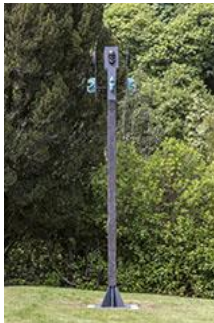
02. Steven Claydon – installation view, The Archipelago of Contended Peoples: Introduced Species , Mount Stuart Castle, Isle of Bute, 2017. © Steven Claydon, courtesy Sadie Coles HQ, London, Fotograaf: Keith Hunter