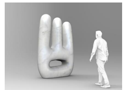
03. Claudia Comte – The Big Marble Bumpy Grumpy , 2019. Carrara wit marmer 280 cm.