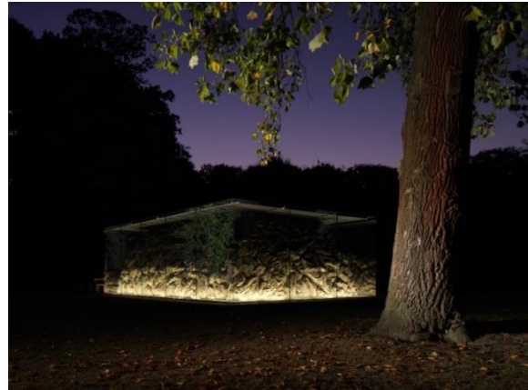
05. Callum Morton - Grotto . Fotografie: Marsel Loermans